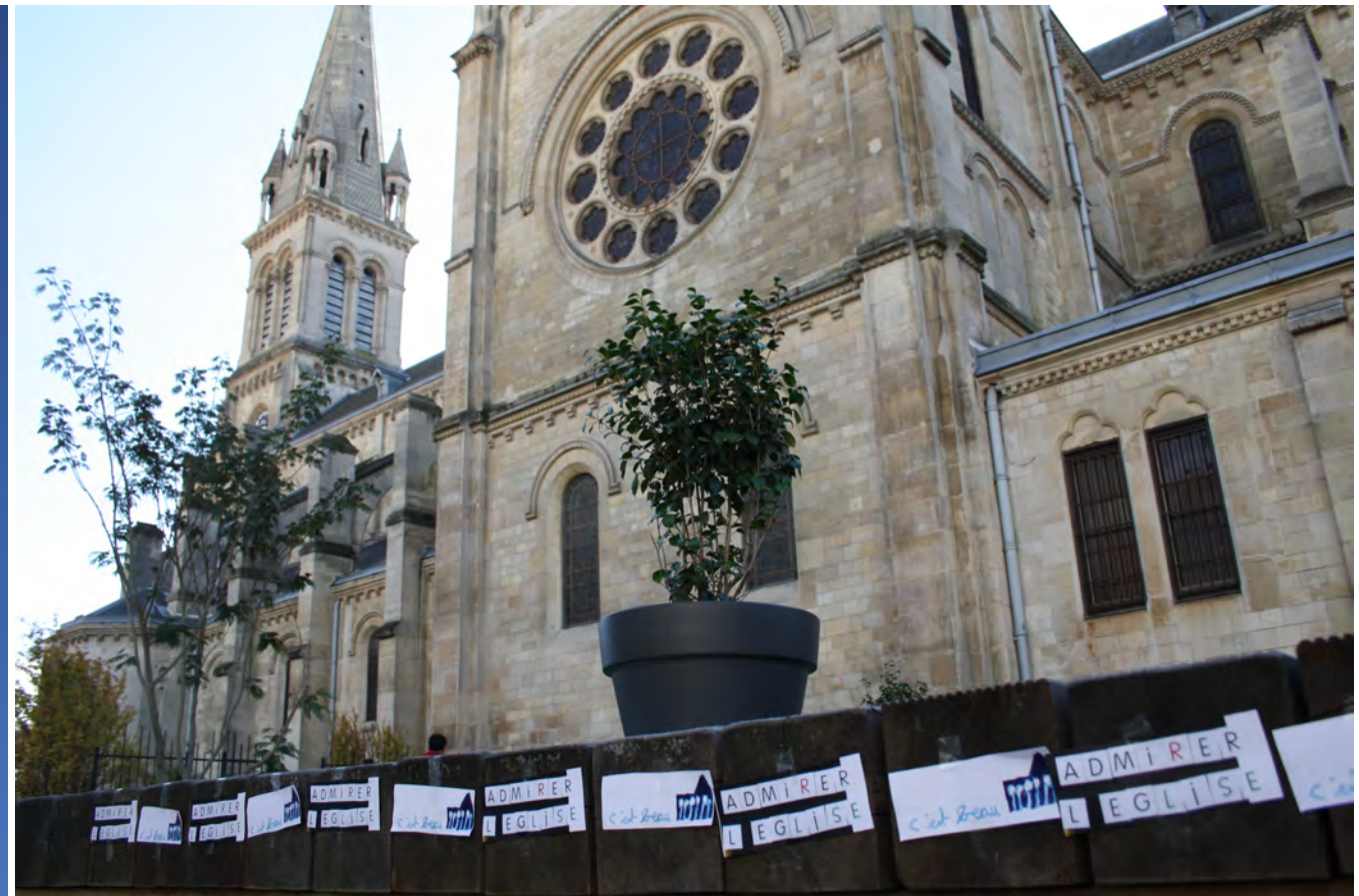
Inciter les passants à regarder l'architecture qui les entoure