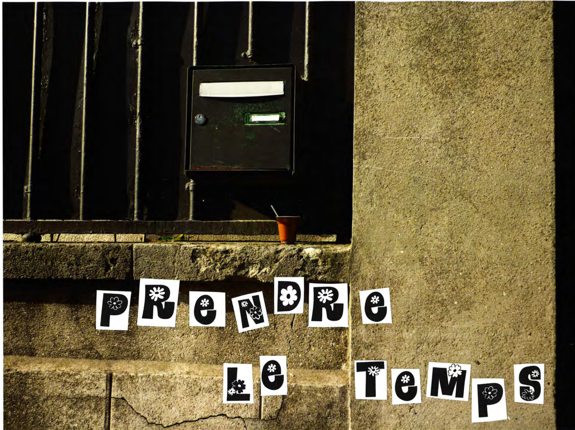
Imaginer des messages forts et les distribuer dans les boîtes aux lettres